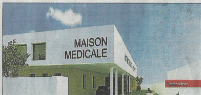
■ À Bellegarde, le projet est prévu rue Fanfonne-Guillaume.

Le territoire, comme de nombreuses régions en France, connaît en effet des pénuries en médecin, avec des départs en retraite non remplacés. L'exemple de Vallabrègues est bien sûr le cas plus emblématique, le village ayant engagé de nombreuses démarches pour trouver un médecin, mais les autres communes du territoire sont également concernées. Cette première convention prévoit une aide financière d'un montant de 800 € mensuels à une externe de la faculté de