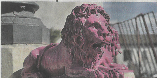
■ Coup de pinceau pour la lutte contre le cancer du sein.

Les lions de la fontaine de Bellegarde annoncent déjà la couleur. Sous l'appellation Octobre rose et dans de nombreux pays du monde, les trente-et-un jours d'octobre mettent à l'honneur la lutte contre le cancer du sein. Un ruban rose identifie généralement ce mouvement. Comme les Bellegardais ont pu le voir dans le programme de la fête d'octobre, un jour de la fête (à savoir le dimanche 14 octobre) a été dédié par solidarité à ce combat. Mieux qu'une affiche qui serait probablement passée inaperçue, l'idée a été d'atti-