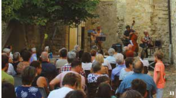
11. Festival Musique et Vieilles pierres