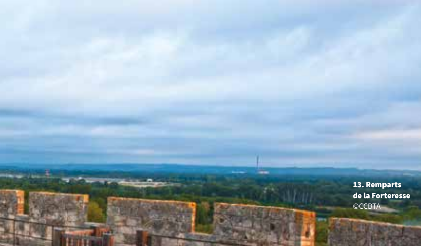
13. Remparts de la Forteresse