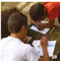
10. Activité pédagogique