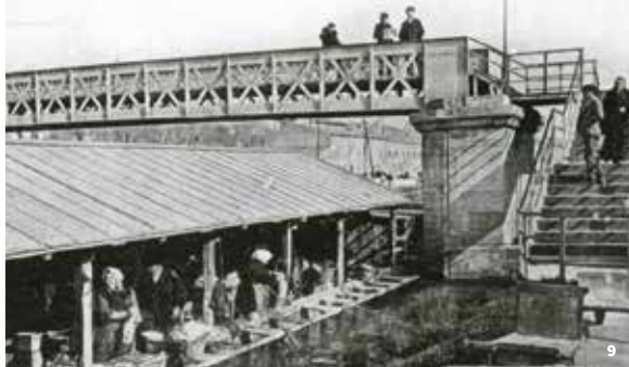
9. Bateau-lavoir sur le canal - Beaucaire vers 1900