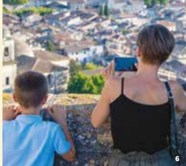
6. Panorama – Forteresse médiévale