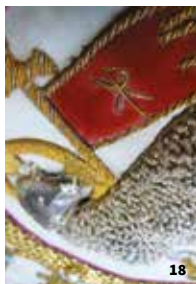
17. Vernissage d'exposition