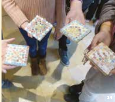
14. Atelier mosaïque