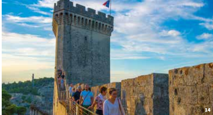
14. Forteresse de Beaucaire ©CCBTA

15. Jeu « Mystères en Terre d'Argence – Vallabrègues » ©CCBTA