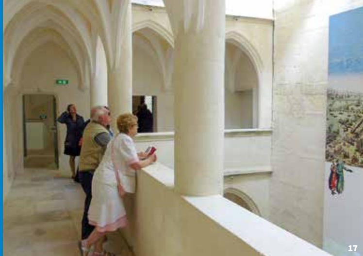
17. Maison du Tourisme et du Patrimoine